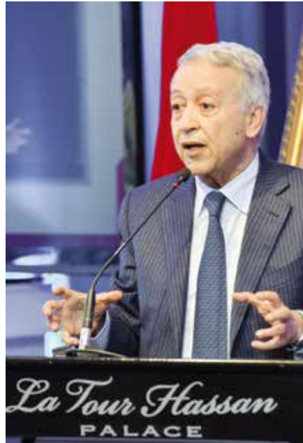
Mohammed SAJID Ministre du Tourisme, du Transport Aérien, de l'Artisanat et de l'Economie Sociale

Heureusement, ce sentiment d'urgence est aujourd'hui partagé par les acteurs publics aussi bien que privés. Nous avons un Ministre du Tourisme et une Secrétaire d'État en charge du secteur qui veulent faire bouger les lignes, et le changement est perceptible à travers les concertations qu'ils ont eues avec les professionnels du secteur. Nous sommes confiants et espérons que la feuille de route du Ministère qui sera dévoilée au cours des prochains jours soit l'occasion d'un renouveau salvateur et d'un sursaut citoyen. Merci pour votre attention. ■