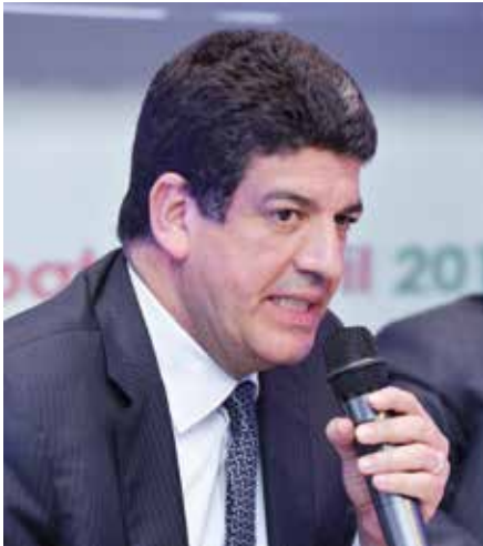
Mustapha BAKKOURY Président de la Région Casablanca/Settat