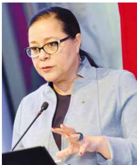
Miriam BENSALAH Présidente CGEM