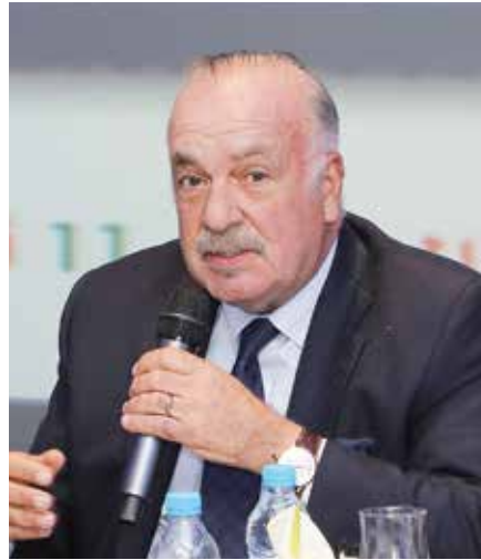
Omar KABBAJ Président Conseil Régional du Tourisme de Casablanca