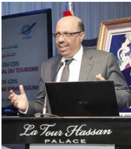
Noureddine BOUTAYEB Ministre Délégué auprès du Ministre de l'Intérieur