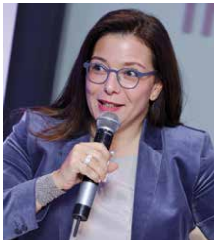
Neïla TAZI Vice-Présidente Chambre des Représentants

Nous avons besoin d'une vigilance de tous les instants, d'un langage de vérité et non de paranoïa constructive. Voici l'essentiel que je voulais partager avec vous. ■